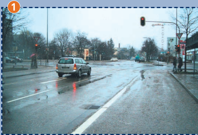
Kreuzung Moosacher Straße/Riesenfeldstraße