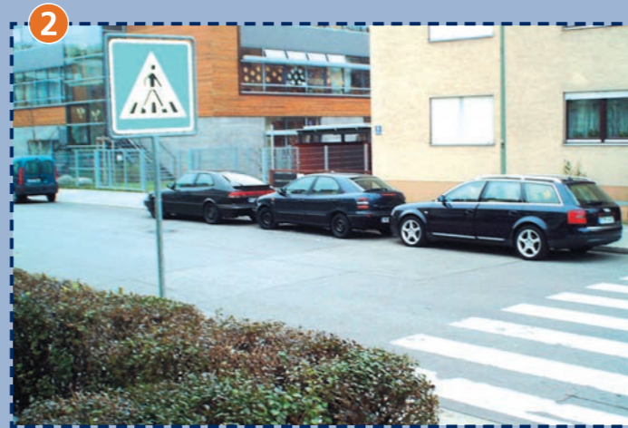
Keferloher Straße – westlich der Schule