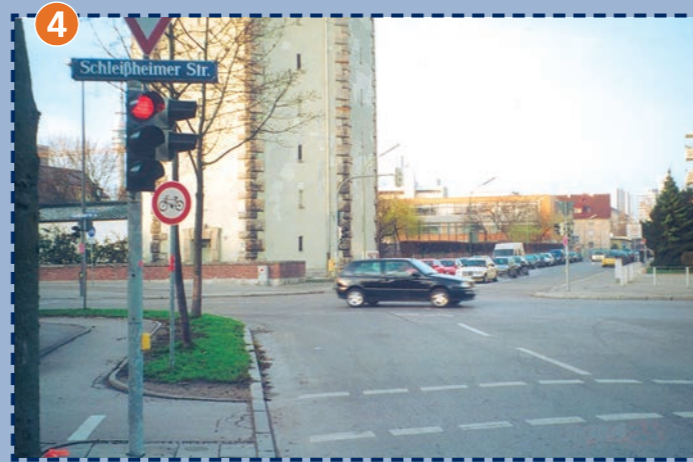
Kreuzung Schleißheimer Straße/Keferloher Straße